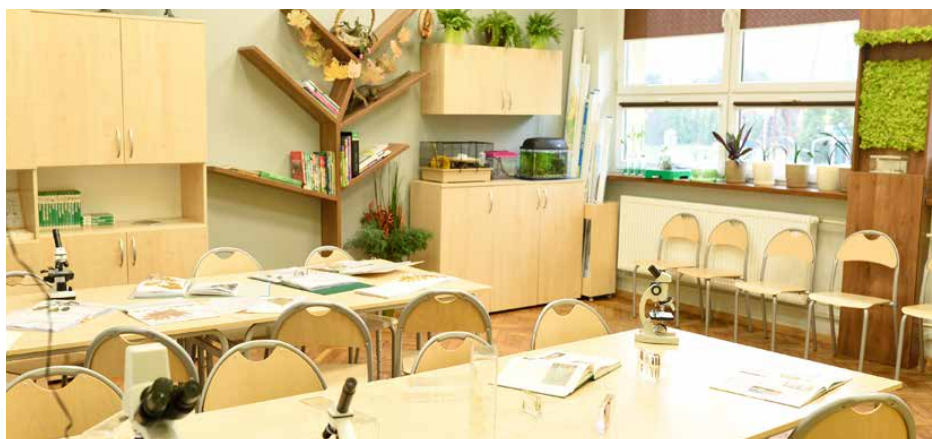
Zielona pracownia w szkole podstawowej w Gródkowie otwarta w 2017 r.

Utworzenie szkolnej ekopracowni przez wyposażenie jej w nowoczesne zaplecze techniczne i różnorodne środki dydaktyczne stanie się dla uczniów wyzwaniem oraz rozbudzi w nich pasję do odkrywania świata przyrody. ZSP Sarnów