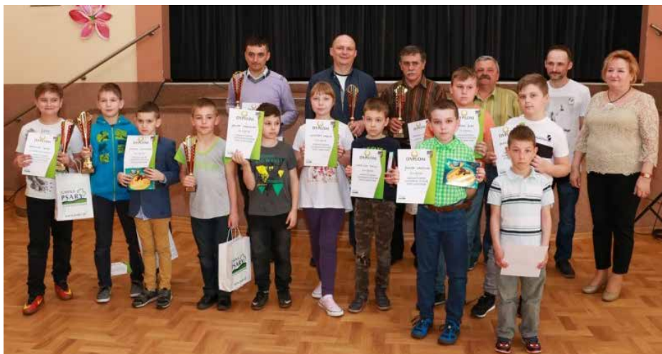
Zwycięzcy Turnieju Szachowego

od tego roku dzieci i młodzież mogą uczyć się techniki tej królewskiej gry na kółku szachowym. Zajęcia odbywają się w Szkole Podstawowej w Strzyżowic