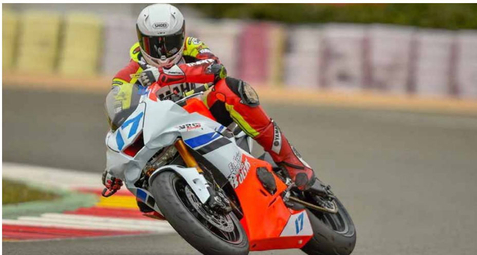
Yamaha klasa Stock 600