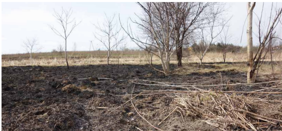
Wypalona trawa przy ul. Gródkowskiej

TK: Z żalem stwierdzam, że w sołectwie Psary – a stąd się wywodzę – najczęściej gasimy pożary traw. Jest to oczywiście związane z licznymi nieużytkami. Największy pożar w tym roku to rejon ulicy Gródkowskiej, na szczęście udało się opanować pożar jeszcze przed zabudową i działkami mieszkańców. Strażacy z naszych jednostek OSP współdziałają także ze strażakami-zawodowcami podczas wypadków drogowych na popularnej dwupasmówce, drodze krajowej 86. Warto o tym pamiętać także w kontekście zaangażowania naszych jednostek w akcje ratunkowe teraz na wiosnę. Red.