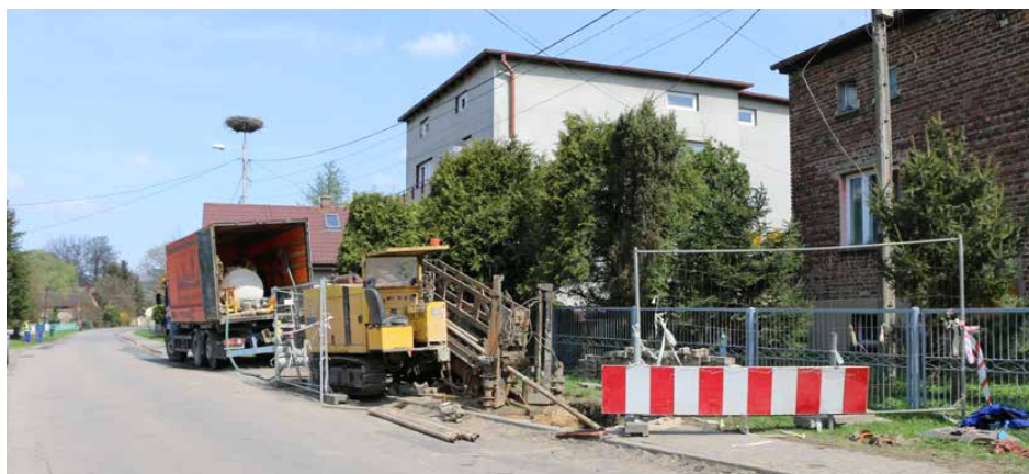
Budowa sieci wodociągowej w Malinowicach

Trwają prace przy budowie wodociągu w Malinowicach od Stacji Uzdatniania Wody przy ul. Wiejskiej oraz na ul. Krótkiej. To część drugiego, z trzech zadań związanych z budową i wymianą 5 odcinków sieci wodociągowej, o łącznej długości blisko 15 km, w tym ponad 2,75 km przyłączy, którą rozpoczęto w 2017 r.