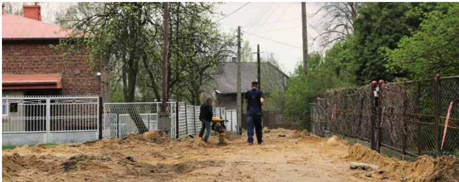
Początkowy etap prac na ul. Zielonej w Preczowie

Ruszyły prace przy budowie odcinka drogi gminnej ul. Zielonej w Preczowie. Wykonawca przedsięwzięcia zakończył już budowę kanalizacji sanitarnej ciśnieniowej w granicach pasa drogowego i przystąpił do realizacji robót drogowych.