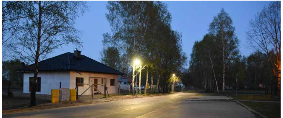
Oświetlona ulica przy ośrodku zdrowia w Psarach

Aktualnie trwają prace instalacyjne w Malinowicach na ul. Brzozowej i Dąbiu Chrobakowym, w Sarnowie na ul. Parkowej i Browarnej, w Strzyżowicach na ul. Podwale oraz w Malinowicach przy pętli autobusowej na ul. Szkolnej. Dotychczas zakończono montaż słupów, pozostaje jeszcze montaż opraw oświetleniowych