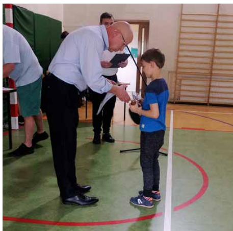
W zawodach uczestniczyli uczniowie szkół podstawowych i gimnazjum

15 kwietnia w Szkole Podstawowej w Psarach odbyła się kolejna edycja Turnieju Tenisa Stołowego o Puchar Wójta Gminy Psary. W zawodach wzięli udział zawodnicy w różnych kategoriach wiekowych.