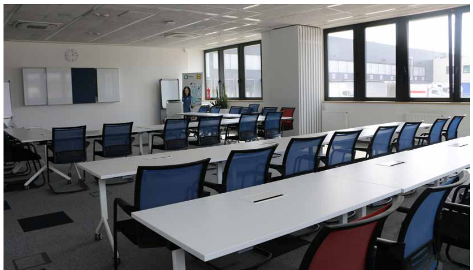
W centrum znajdują się pomieszczenia biurowe, administracyjne i socjalne