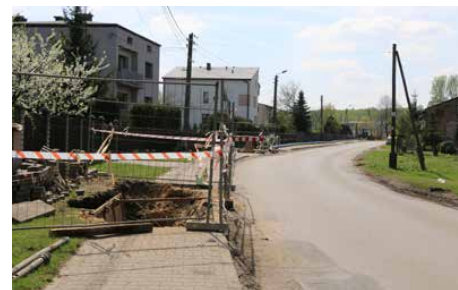
Część prac prowadzona jest metodą bezwykopową

Warto zaznaczyć, że prace w znacznej części prowadzone są metodą bezwykopową, co usprawnia i ułatwia wykonywanie głównych odcinków sieci. Powstające przyłącza do budynków są zakończone mrozoodpornymi studzienkami, wyposażonymi w wodomierze z funkcją odczytu radiowego. Red.