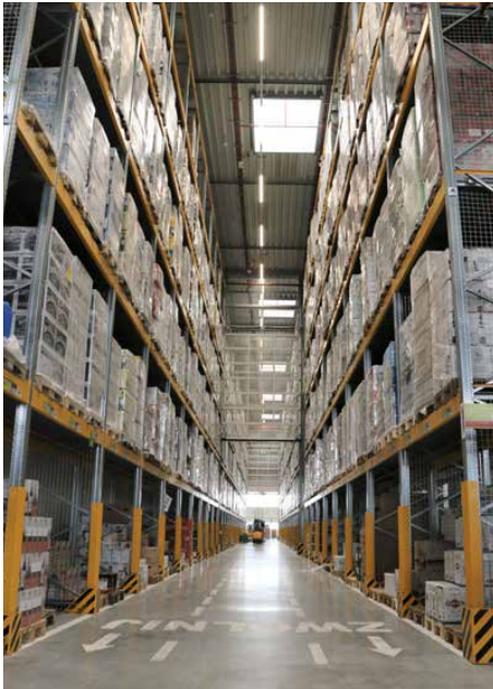
Magazyn w Gródkowie

Od czerwca 2017 r. w Gródkowie działa centrum dystrybucyjne firmy Lidl, w którym zatrudnienie znalazło już przeszło 200 osób, a firma nadal szuka nowych pracowników.