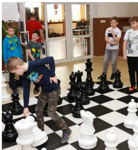
Duże szachy polowe okazały się wielką atrakcją

14 kwietnia w Gminnym Ośrodku Kultury odbył się Turniej Szachowy o Puchar Wójta Gminy Psary dla dzieci oraz dorosłych.