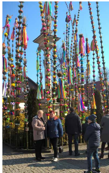
Wystawa palm na lipnickim rynku

Niedziela Palmowa w Małopolsce pozostanie w pamięci członków Klubu Seniora Brzękowie-Goląsza źródłem niezapomnianych wrażeń i miłych wspomnień. TKG