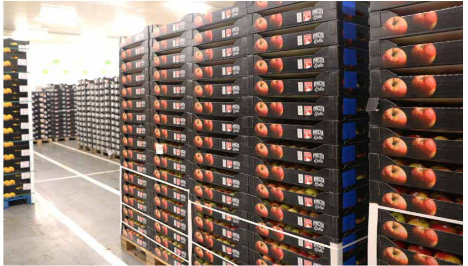
Strefa, w której składowane są owoce