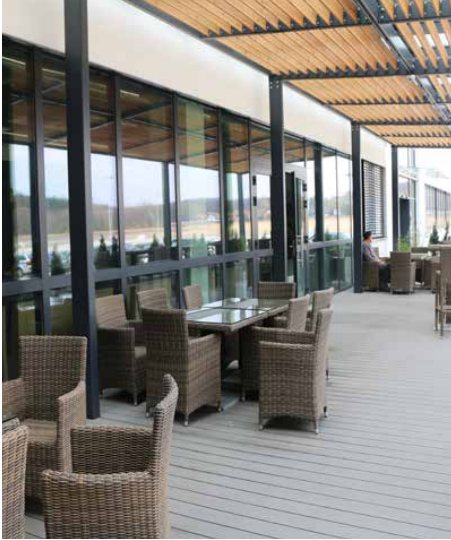
Pracownicy mogą korzystać z tarasu