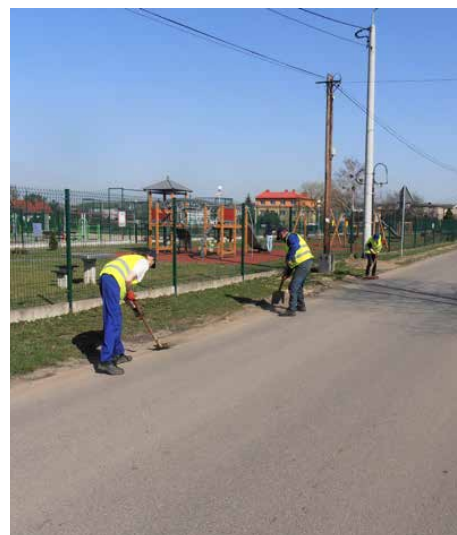
Pracownicy ZGK podczas pracy