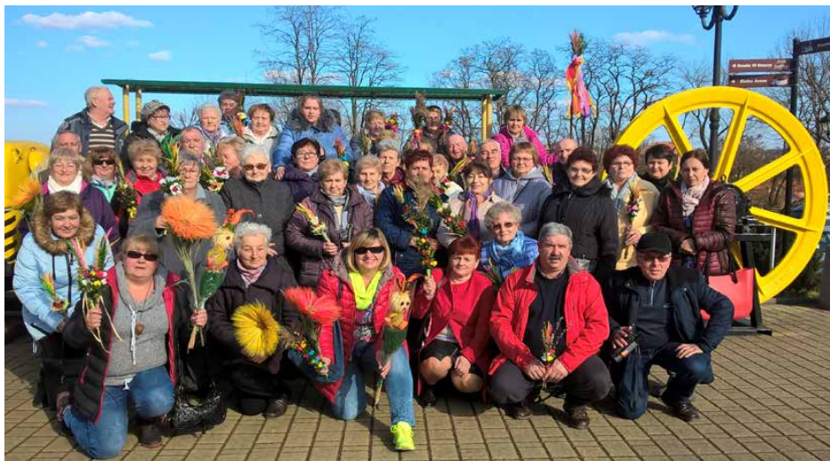
Uczestnicy wycieczki z palmami przed kopalnią w Bochni

Lipnica Murowana to niewielka małopolska miejscowość, której turystyczną wizytówką jest konkurs palm wielkanocnych, przyciągający od 60 lat tłumy miłośników tradycji z całego kraju. I właśnie w tym wyjątkowym miejscu, gdzie powstają najpiękniejsze i największe palmy wielkanocne w Polsce, tegoroczną Niedzielę Palmową spędzili członkowie Klubu Seniora Brzękowie-Goląsza.