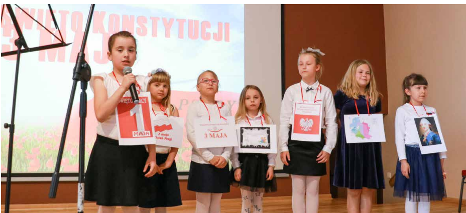
Występ artystyczny uczestników zajęć teatralnych z Ośrodka Kultury w Sarnowie