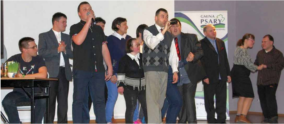
Uczestnicy Warsztatów Terapii Zajęciowej z Będzina podczas występu

22 marca sala bankietowa w Psarach wypełniła się aż po brzegi. Powód? W jej murach gościli uczestnicy Warsztatów Terapii Zajęciowej z Będzina, którzy oprócz wspaniałego występu artystycznego podzielili się z mieszkańcami swoim rękodziełem.