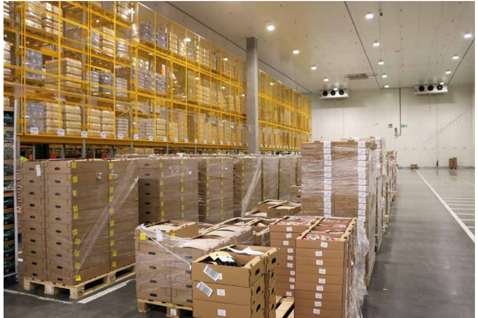
Jedna ze stref w centrum dystrybucyjnym

W 2017 r. w Gródkowie, na blisko 20 ha działce, stanął magazyn o powierzchni 45 300 m 2 , który zaopatruje blisko 60 sklepów, znajdujących się w województwach śląskim i małopolskim. Dotychczas zostało w nim zatrudnionych ponad 200 pracowników, z czego ponad 50 to mieszkańcy gminy Psary. Obecnie prowadzone są kolejne rekrutacje m.in. na stanowisko pracownika magazynu – komisjonera (szczegóły na stronie https://kariera.lidl.pl ).