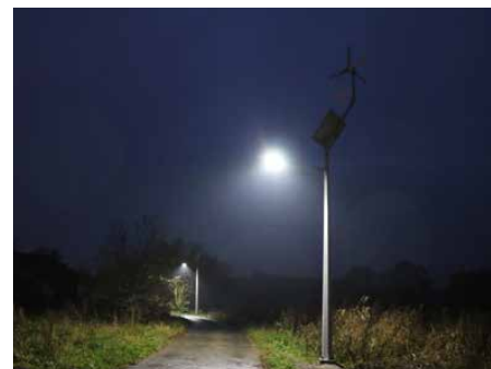
Nowe oświetlenie hybrydowe.

Wykonawcą przedsięwzięcia pn: „Budowa oświetlenia hybrydowego przy ul. Zielonej w Malinowicach” była firma Petra Energia Sp. z o.o. z siedzibą w Macierzysz ul. Sochaczewska 110, 05-850 Ożarów Mazowiecki. Red.