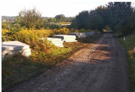
Ulica Źródłana przed remontem.

W PAŹDZIERNIKU ZAKOŃCZONO REMONT UL. ŹRÓDLANEJ W SARNOWIE. POPRZECZ UTWARDZENIE ISTNIEJĄCEJ DROGI GMINNEJ DROGOWYMI ZBROJONYMI PŁYTAMI BETONOWYMI, POWSTAŁA NOWA NAWIERZCHNIA JEZDNI NA 790 METROWYM ODCINKU DROGI.