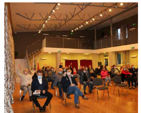
Głosowanie nad podziałem środków.

Warto również wspomnieć, że na zebraniu wiejskim w Strzyżowicach i Malinowicach odbyły się wybory uzupełniające do rad sołeckich. Red.