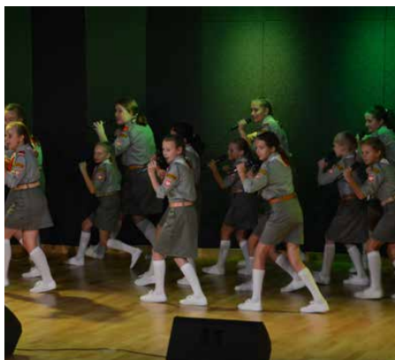
Pokaz artystyczny zespołu.