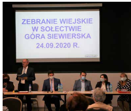
Zebranie wiejskie w Górze Siewierskiej.

sażenie Zespołu Szkolno-Przedszkolnego w Strzyżowicach (11 000 zł), usługę szycia strojów, zakup obuwia i piknik integracyjny dla mieszkańców Sołectwa z okazji 90-lecia KGW Strzyżowice (6 203,54 zł) oraz remont pomieszczeń użytkowych OSP Strzyżowice (20 000 zł) • w Goląszy 39 350,75 zł na: wybudowanie drugiej altanki na terenie rekreacyjnym za budynkiem szkoły (30 000 zł), zakup strojów KGW Brzękowie Górne i KGW Goląsza Górna (4 000 zł), dofinansowanie Klubu Seniora Brzękowie – Goląsza (1 000 zł) oraz zakup wyposażenia do budynku byłej szkoły (4 350,75 zł)