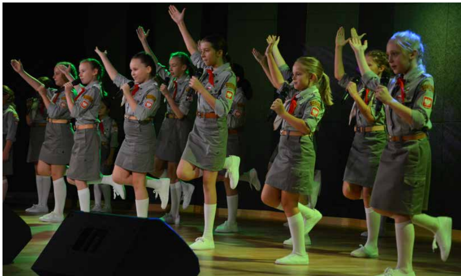
Występ zespołu „Słoneczni” w CUS Strzyżowice

KONCERT ODBYŁ SIĘ Z OGRANICZONĄ LICZBĄ ZAPROSZONYCH GOŚCI ORAZ W REŻIMIE SANITARNYM ZWIĄZANYM Z COVID-19. „MARSZ NAPRZÓD NASZA DRUŻYNO, W DÓŁ NIGDY, LECZ ZAWSZE WZWYŻ PO LATACH KTÓRE PRZEMINĄ HARCERSKI ZOSTANIE KRZYŻ, HARCERSKI KRZYŻ”