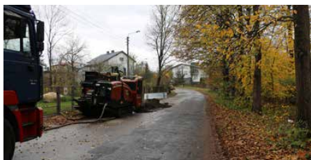
Prace przy budowie wodociągu.

ZAKŁAD GOSPODARKI KOMUNALNEJ W PSARACH, PODEJMUJE CO ROKU SZEREG ZADAŃ ZWIĄZANYCH Z PRZEBUDOWĄ SIECI WODOCIĄGOWEJ DOSTARCZAJĄCEJ WODĘ DO MIESZKAŃCÓW GMINY PSARY, W CHWILI OBECNEJ NOWY WODOCIĄG POWSTAJE W PRECZOWIE NA ULICY DĘBOWEJ.