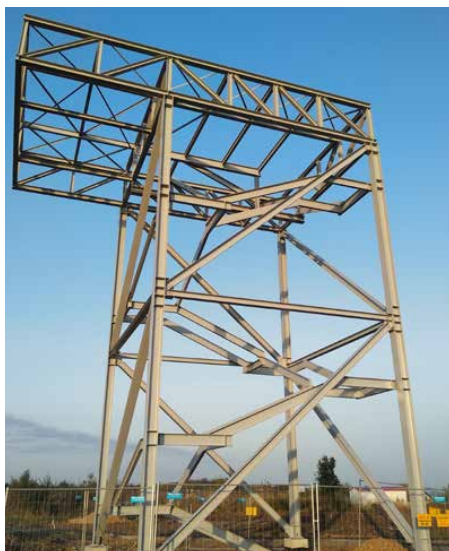
Konstrukcja wieży widokowej w Górze Siewierskiej.

Każdego dnia w Górze Siewierskiej widać postępy prac budowlanych związanych z realizacją zadania pn: „Zagłębiowski Park Linearny – rewitalizacja obszaru funkcjonalnego doliny rzeki Przemszy i Brynicy” – etap I. Wszystkie prace realizowane są przez firmę MAXIMUS Michał Seńków z siedzibą w Tarnowskich Górach zgodnie z przyjętym harmonogramem.