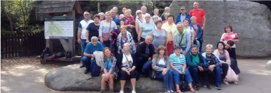
Seniorzy na wycieczce w Błędnych Skałach.

KLUB SENIORA, JAKO ISTNIEJĄCA GRUPA NIEFORMALNA OD 2012 R. ROZPOCZĄŁ SWOJĄ DZIAŁALNOŚĆ W DOMU KULTURY W SARNOWIE POD PATRONATEM GOK GMINY PSARY. OBECNIE PRZEKSZTAŁCIŁ SIĘ W STOWARZYSZENIE PN. „KLUB SENIORA PODRÓŻNIKA” Z SIEDZIBĄ W STRZYŻOWICACH I DALEJ KONTYNUUJE SWE DZIAŁANIA W OBRANYM KIERUNKU.