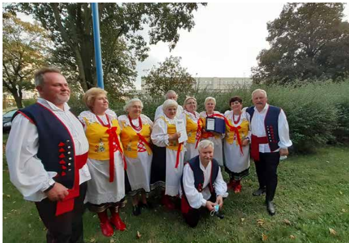
Zespół „Od do” z Preczowa.

3 PAŹDZIERNIKA W CZĘSTOCHOWIE ODBYŁA SIĘ SZÓSTA EDYCJA SPOTKAŃ FOLKLORYSTYCZNYCH „ETNOSTRADA”. W FINAŁOWYCH PREZENTACJACH PRZEGLĄDU ZESPÓŁ „OD DO” Z PRECZOWA ZAJĄŁ II MIEJSCE.