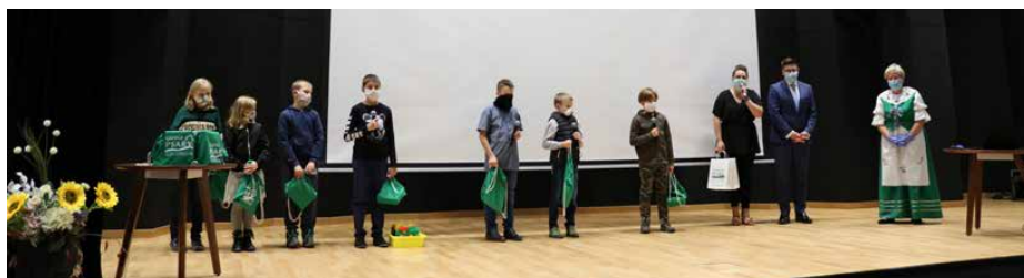
Uczestnicy projektu „Filmowe Gminne Opowieści”.

Realizacja, aż dwóch inicjatyw w tak trudnym okresie, nie była łatwym zadaniem. Wszystkie działania, takie jak rekrutacje i same warsztaty, w obydwu projektach zostały przeniesione do sieci. Przygotowania i opracowanie materiałów do stworzenia filmu czy strony internetowej wymagało wielu godzin wspólnej pracy i wielotorowych działań ze strony pracowników GOK. Wszystkim pracownikom GOK składamy serdeczne podziękowania za zaangażowanie oraz pełen profesjonalizm włożony w realizację projektów. GOK.