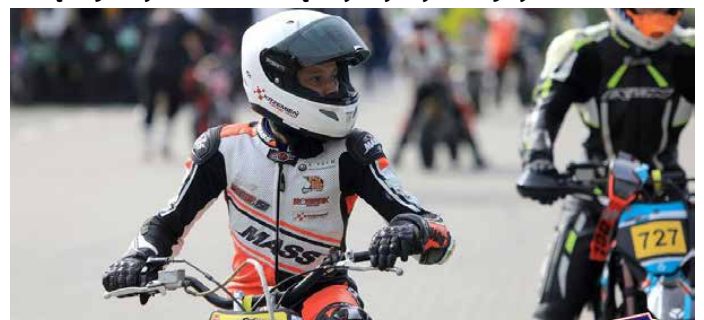
Przygotowanie do jazdy.