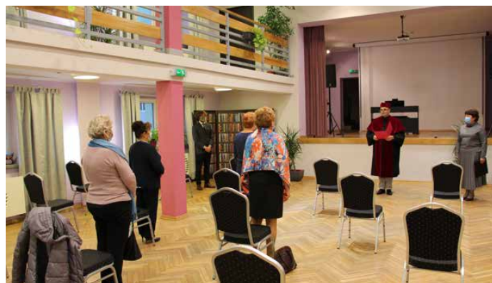
Członkowie Uniwersytetu Trzeciego Wieku.