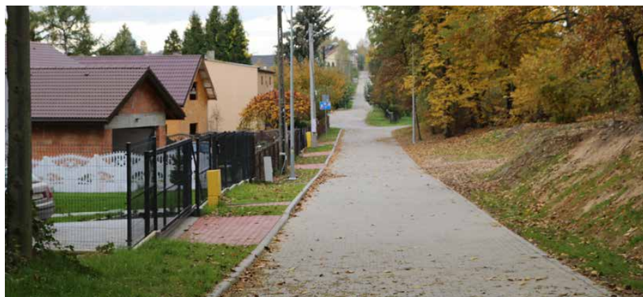
Nowy ciąg pieszo-jezdny w Gródkowie.

wybudowany z myślą o mieszkańcach, aby ułatwić im bezpieczne przejście do DW 913, GOK-u, przystanków autobusowych, sklepów oraz apteki.