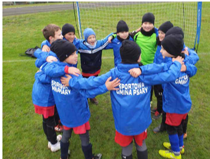
Taniec zwycięzców po wygranym meczu.

Przed nami sezon jesienno – zimowy, przygotowujący do rundy wiosennej. Wszystkich chętnych do gry serdecznie zapraszamy na treningi, które w tym okresie odbywać będą się na sali gimnastycznej w SP w Psarach. Razem damy radę – będzie dobrze. Red.