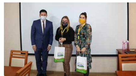
Spotkanie z przedstawicielkami firmy DHL w budynku urzędu.

W chwili obecnej DHL Supply Chain poszukuje pracowników, wszystkie informacje można znaleźć na naszej stronie w zakładce Oferty Pracy i plakacie na ostatniej stronie gazety. Red.