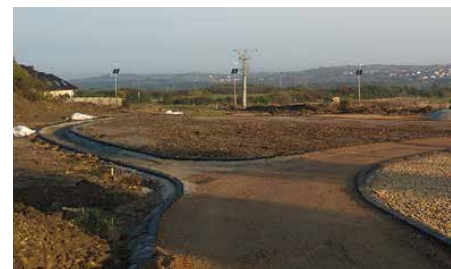
Prace przy budowie Parku Linearnego.

Zadanie zostanie zrealizowane w terminie do 30 listopada 2020 r. i wsparte jest dotacją z Górnośląsko-Zagłębiowskiej Metropolii w wysokości 300 000,00 zł oraz ze środków unijnych (Europejskiego Funduszu Rozwoju Regionalnego) w ramach RPOWSL w kwocie 1 216 639,12 zł. Ten etap projektu odbywa się bez wkładu ze środków własnych gminy i w 100% jest finansowany krajową i unijną dotacją. Red.