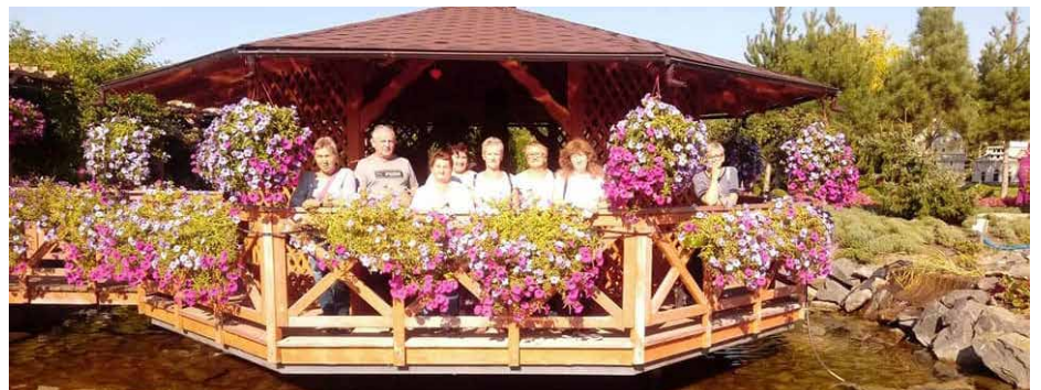
Klub Seniora w Parku Miniatur „Minieuroland” w Kłodzku.

29 sierpnia 2020 Członkowie Klubu Seniora Podróżnika uczestniczyli w wycieczce do Świdnicy, Szczawna Zdroju