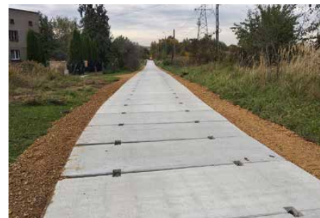
Zbrojone płyty betonowe.