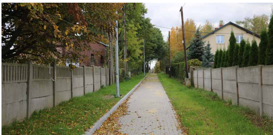
Ciąg pieszy po przebudowie.

Równoległe do ul. Wspólnej, przy ogrodzeniu tartaku został wybudowany ciąg pieszy oraz dojazd do posesji mieszkańców. Powstał chodnik o szerokości 2 m z energooszczędnym oświetleniem LED, które ma na celu poprawienie bezpieczeństwa pieszych oraz ciąg pieszo-jezdny o szerokości 4,2 m. Chodnik został