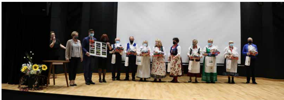
Członkowie KGW Góra Siewierska.

Z DUŻYM OGRANICZENIEM ORAZ W PEŁNYM REŻIMIE SANITARNYM, W PIĄTEK 23 PAŹDZIERNIKA ODBYŁA SIĘ INAUGURACJA ROKU KULTURALNEGO W CENTRUM USŁUG SPOŁECZNYCH W STRZYŻOWICACH. Z RACJI WSZECHOBECNEJ PANDEMII I WIELU OBOSTRZEŃ, W TYM ROKU WYDARZENIE TO WYGLĄDAŁO ZUPEŁNIE INACZEJ. TEGOROCZNA DZIAŁALNOŚĆ GOK Z UWAGI NA BEZPIECZEŃSTWO UCZESTNIKÓW I RZĄDOWE OBOSTRZENIA ZOSTAŁA BARDZO MOCNO OGRANICZONA, CO WYRAŹNIE PRZEŁOŻYŁO SIĘ NA ILOŚĆ IMPREZ.