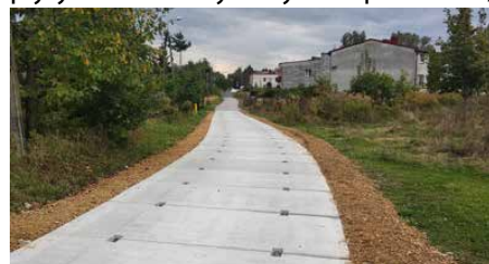
Utwardzenie istniejącej drogi gminnej.

0,5 m. Nawierzchnie z płyt cechuje wiele zalet, najważniejsze z nich to: cena znacznie niższa od konkurencyjnych rozwiązań, stabilność, wytrzymałość na zniszczenia, ścieranie, wypłukiwanie, zamarzanie, zdolność do przeniesienia wysokich obciążeń, prawie zerowe koszty utrzymania oraz fakt, że płyty można wykorzystać ponownie,