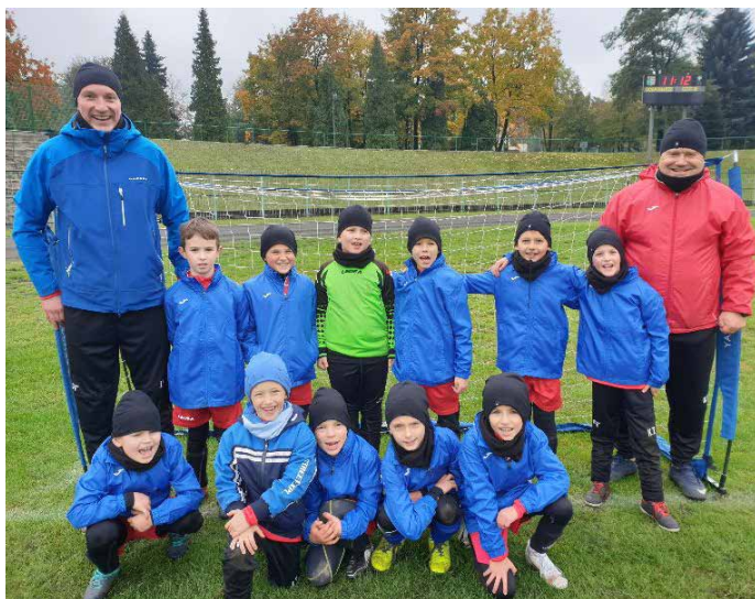
Reprezentacja F1 Sportowa Gmina Psary.

W OSTATNICH MIESIĄCACH PODPORZĄDKOWANYCH WALCE Z KORONAWIRUSEM, ZAWODNICY NIE MARNOWALI CZASU I KORZYSTALI Z KAŻDEJ MOŻLIWOŚCI, BY DBAĆ O KONDYCJĘ I UCZESTNICZYĆ W ROZGRYWKACH. TEN WYJĄTKOWY POD KAŻDYM WZGLĘDEM SEZON, PRZYNIÓSŁ JEDNAK WIELE SATYSFAKCJI I OKAZJI DO RADOŚCI.