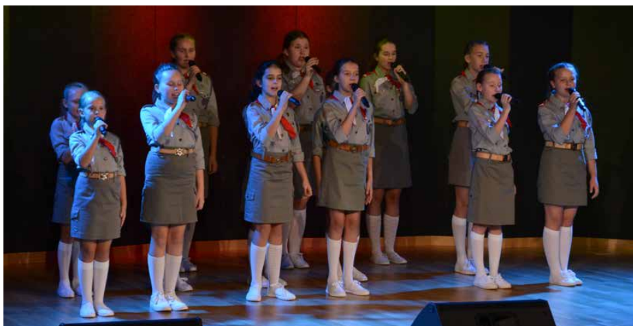
Koncert zachwylił zgromadzonych gości.