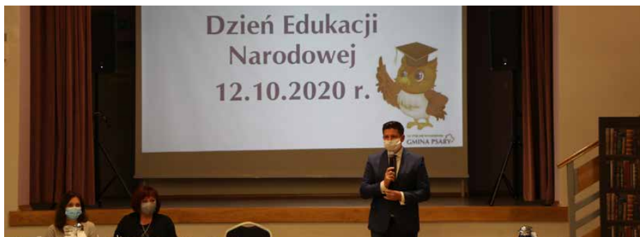
Podsumowanie pracy gminnej oświaty.

W ZWIĄZKU Z SYTUACJĄ EPIDEMIOLOGICZNĄ W KRAJU DOTYCZĄCĄ ROZPRZESTRZENIANIA SIĘ KORONAWIRUSA, W TYM ROKU NIE OBCHODZILIŚMY TEGO DNIA, TAK JAK DOTYCHCZAS, ALE KAMERALNIE, W ZAMKNIĘTYM GRONIE I Z ZACHOWANIEM PEŁNEGO REŻIMU SANITARNEGO.