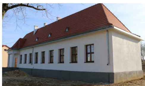
TRWAJĄ INTENSYWNE PRACE W BUDYNKU BYŁEJ SZKOŁY W GOLĄSZY GÓRNEJ S. 2