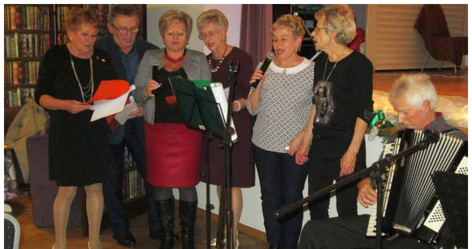
Jasełka u emerytów z Psar

ły się tradycyjne jasełka organizowane przez stowarzyszenie. 9 stycznia w sali bankietowej w Psarach zaproszeni goście mogli zobaczyć widowisko teatralno-muzyczne przygotowane przez uczniów SP Psary. Po przedstawieniu na dzieci czekały upominki, a wspólne koledowanie było dla wszystkich ogromną przyjemnością. EK