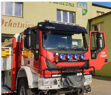
Jednostka OSP Psary z nowym wozem W listopadzie do jednostki Ochotniczej Straży Pożarnej w Psarach trafił nowy średni wóz ratowniczo-gaśniczy. Jego wartość to blisko 760 tys. zł.