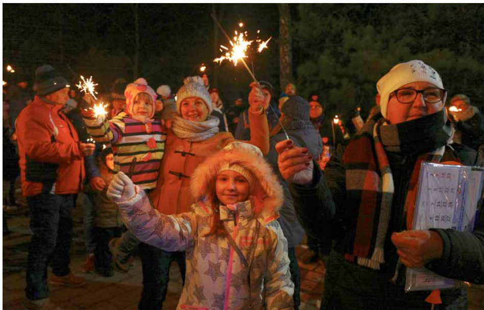
Świąteczne światło do nieba stało się niepisaną tradycją finału WOŚP

ZA NAMI JUŻ 28 FINAŁ WIELKIEJ ORKIESTRY ŚWIĄTECZNEJ POMOCY. PSARY PO RAZ 10. WŁĄCZYŁY SIĘ W AKCJĘ I ZAGRAŁY RAZEM Z WOŚP.