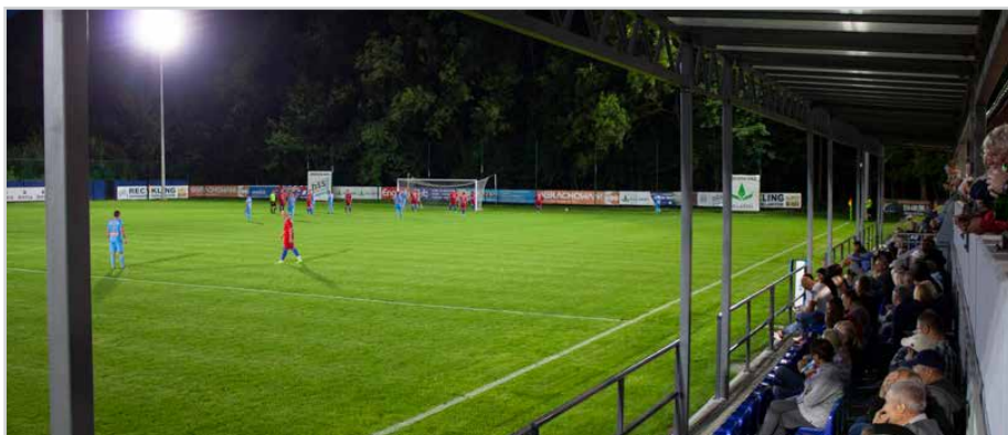
Stadion sportowy w Sarnowie Piłkarze z Sarnowa od 2019 roku trenują na kompleksowo przebudowanym stadionie. Sportowcy mają do swojej dyspozycji nowy budynek szatni, zmodernizowaną płytę boiska z systemem automatycznego nawadniania, zadaszone trybuny, nowe wiaty dla zawodników rezerwowych i oświetlenie sportowe umożliwiające grę po zmroku.