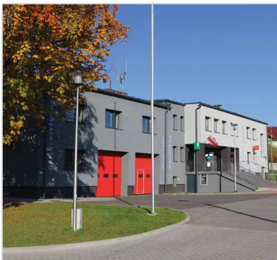
Centrum Usług Społecznych w Strzyżowicach W 2019 roku do mieszkańców wrócił wielofunkcyjny, nowoczesny i ekologiczny obiekt, który stał się sercem życia społecznego, edukacyjnego i kulturalnego gminy. W Centrum Usług Społecznych organizowane są różnego rodzaju koncerty, szkolenia i przedstawienia.