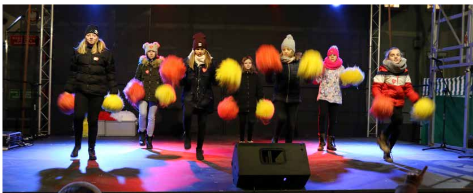
Na scenie zaprezentowali się młodzi mieszkańcy gminy Psary

Tegoroczny gminny finał rozpoczął się o godz. 17:00 na placu przed Urzędem Gminy w Psarach. Jak co roku, koncert był znakomitą okazją, aby na scenie przed licznie zgromadzoną publicznością, zaprezentowali się młodzi i utalentowani mieszkańcy gminy Psary. Występy uczniów ze szkół i zespołów