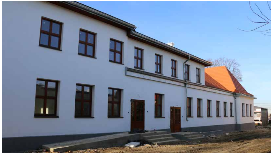
Budynek byłej szkoły w Goląszy Górnej poddany został gruntownej modernizacji

Budynek byłej szkoły w Goląszy Górnej poddany został gruntownej modernizacji. Dotychczas wykonano prace budowlane wewnętrzne i zewnętrzne, wymieniono stolarkę okienną i drzwiową, wykończono elewację zewnętrzną, wyremontowano dach i odtworzono odgromienie, wykonano przyłącza wodno-kanalizacyjne, remont wewnętrznej instalacji elektrycznej, na dachu zamontowano instalację fotowoltaiczną. Obec-