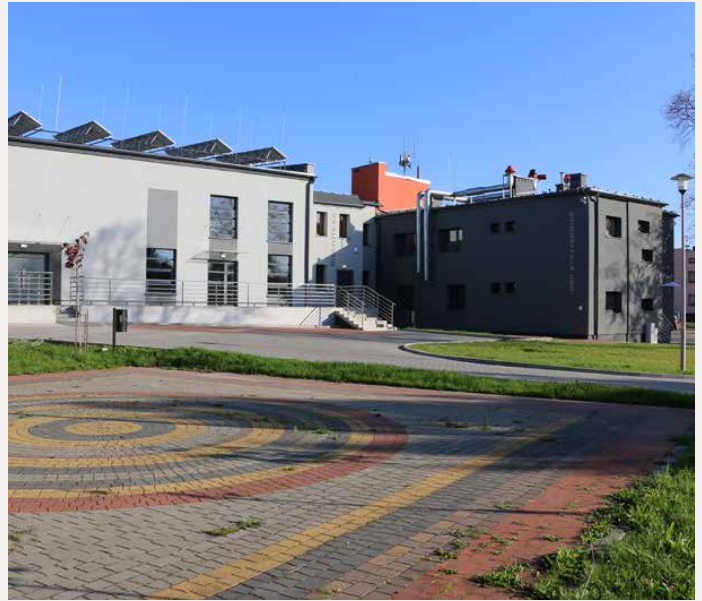
Odnawialne źródła energii w Centrum Usług Społecznych w Strzyżowicach

Sukcesywnie zmianie podlegają również dotychczasowe źródła ciepła: kotłownie na drzewo oraz węgiel, a także przestarzałe piece gazowe. Zastępowane są one pompami ciepła lub nowoczesnymi, ekologicznymi kotłowniami ga-