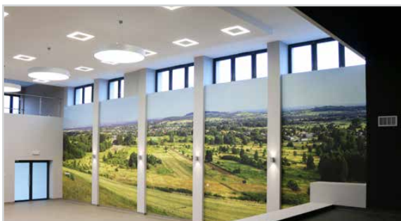
Remiza i Ośrodek Kultury w Górze Siewierskiej Kolejną otwartą placówką kulturalną w 2019 roku jest remiza i Ośrodek Kultury w Górze Siewierskiej. Dzięki kompleksowej przebudowie i termomodernizacji w budynku powstała nowoczesna sala widowiskowa ze sceną i oświetloną antresolą.