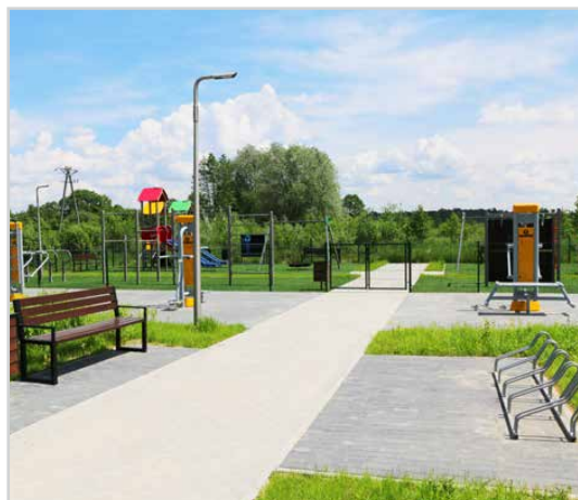
Strefa rekreacyjna w Dąbiu Chrobakowym W Dąbiu Chrobakowym powstała strefa rekreacyjna, w której zarówno młodszy jak i starsi mieszkańcy gminy znajdą coś odpowiedniego dla siebie. Mamy tutaj plac zabaw, siłownię zewnętrzną i strefę street workout.