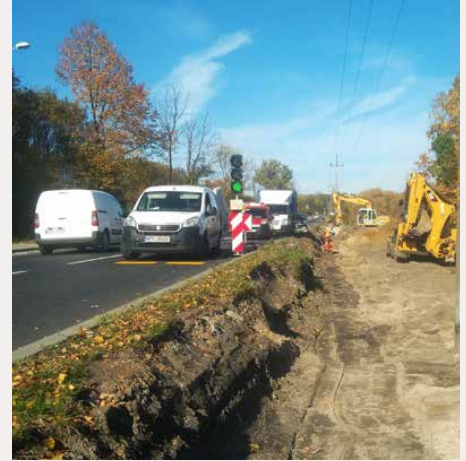
Przebudowa sieci wodociągowej na DW 913

Całkowita wartość inwestycji to 124 851 916,29 zł z czego 50 150 000,00 zł stanowi dotacja unijna zaś 7 287 970,27 zł to wkład własny gminy. Umowny termin zakończenia i rozliczenia całości zadania to 15.12.2021 r. Inwestorem przedsięwzięcia jest Zarząd Dróg Wojewódzkich w Katowicach, a Wykonawcą firma Strabag Infrastruktura Południe Sp. z o. o. Red.