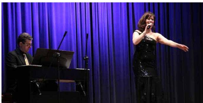
Muzyka operetkowa w Gródkowie

W SOBOTNIE POPOŁUDNIE, 18 STYCZNIA, W GMINNYM OŚRODKU KULTURY W GRÓDKOWIE, ROZBRZMIAŁY NAJWIĘKSZE I NAJBARDZIEJ LUBIANE DZIEŁA OPERETKOWE ŚWIATA.