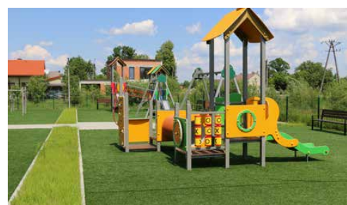
FOTOGRAFICZNY PRZEGLĄD INWESTYCJI 2019