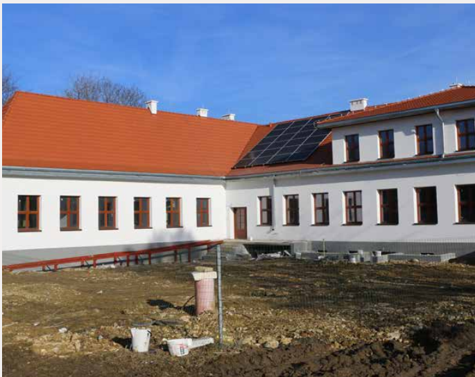
Panele fotowoltaiczne na budynku byłej szkoły w Goląszy Górnej

Kluczowe korzyści wynikające z realizacji projektów obejmują przede wszystkim zmniejszenie zapotrzebowania na energię cieplną budynków, co przekłada się na