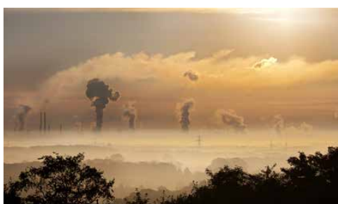
WALCZYMY ZE SMOGIEM - DODATEK S. 7-10