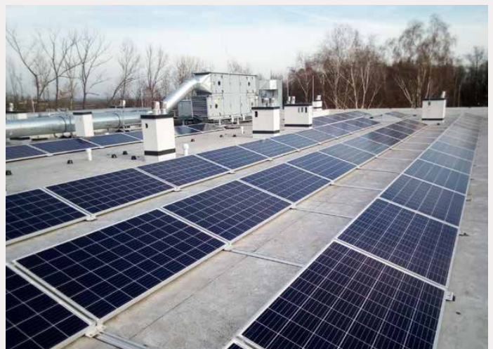
Panele fotowoltaiczne na budynku żłobka w Psarach

W sumie we wszystkich (oprócz jednego - była szkoła w Górze Siewerskiej) obiektach przeprowadziliśmy termomodernizację. W 12 pojawiły się instalacje fotowoltaiczne, 8 z nich w całości lub częściowo wyposażyliśmy w klimatyzację. Instalacja solarna pojawiła się w Przedszkolu im. Misia Uszatka w Strzyżowicach. W tej samej miejscowości Centrum Usług Społecznych ogrzewane jest przez nowoczesną pompę ciepła. Red.