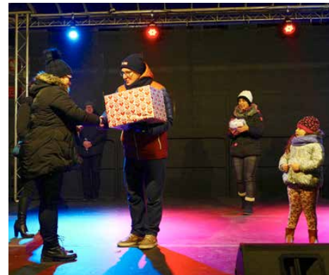
Wójt Gminy Psary wręcza nagrody w quizie fantowym