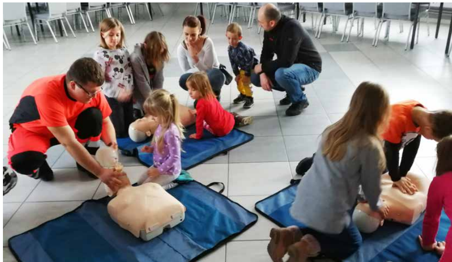
Zajęcia pierwszej pomocy przedmedycznej w czasie ferii

W tym roku zimowa przerwa w zajęciach szkolnych rozpoczęła się bardzo wcześnie. Nie zaskoczyło to jednak organizatorów, którzy jak co roku przygotowali mnóstwo różnorodnych zajęć. Ferie upłynęły bardzo pracowicie, powstały m.in. gustowne kapelusze, eleganckie kartki okolicznościowe, zimowe lampiony, figurki z masy solnej, modne eko-torby, kukielki i pacynki. Odbyły się tematyczne quizy i łamigłówki, a dzięki uprzejmości druhów OSP Gołusza-Brzękowie udało się zorganizować kurs pierwszej pomocy przedmedycznej dla dzieci. Młodzi adepci ratownictwa mogli sprawdzić się w samodzielnej akcji resuscytacji pod okiem wykwalifikowanego instruktora. Tegoroczna oferta zajęć obejmowała również zabawy integracyjne, rozgrywki x-box, eko-warsztaty i zajęcia teatralne. Zawodnicy Akademii Piłkarskiej uczestniczyli w tygodniowym turnusie półkolonii, który poza treninga-