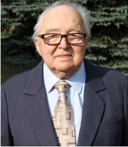
Autor albumu Zdzisław Rabsztyń.

W KOŃCU SIERPNI 2019 ROKU UKAZAŁ SIĘ ALBUM „STRYŻOWICE W DOKUMENTACH DAWNEJ I WSPÓŁCZESNEJ FOTOGRAFII” AUTORSTWA ZDZISŁAWA RABSZTYNA.