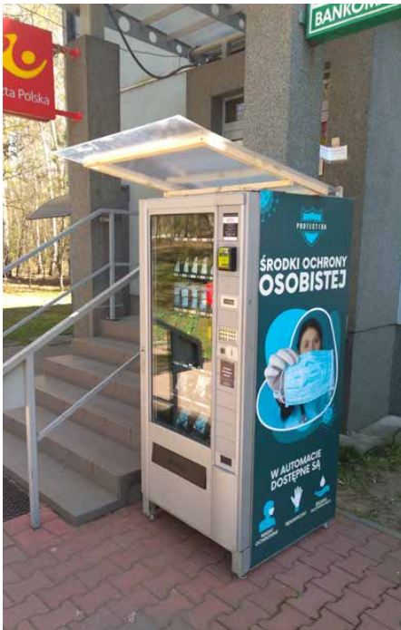
„HIGIENOMAT” przy budynku Urzędu Gminy Psary

WSZYSTKIE ŚRODKI OCHRONY OSOBISTEJ SŁUŻĄCE DO ZABEZPIECZENIA PRZED WIRUSEM COVID-19 OD DZIŚ DOSTĘPNE SĄ W SPECJALNYM AUTOMACIE, KTÓRY STANĄŁ PRZY BUDYNKU URZĘDU GMINY W PSARACH. W SPOSÓB BEZGOTÓWKOWY I BEZPIECZNY MOŻNA NABYC MASECZKI OCHRONNE, RĘKAWICZKI I PŁYNY ODKAŻAJĄCE.