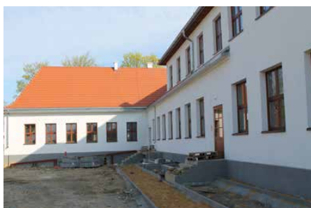
Zakończono tynkowanie ścian zewnętrznych

Wykonano również szereg prac niewidocznych gołym okiem, takich jak nowa instalacja wodno-kanalizacyjna oraz nowe przyłącze wodociągowe do budynku. Zabudowano w terenie prefabrykowane szambo i podłączono