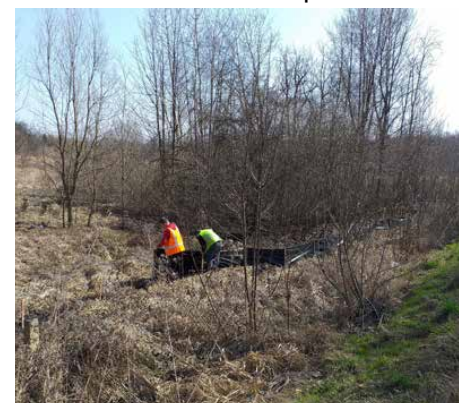
Montaż płotek herpetologicznych

Całkowita wartość inwestycji to 124 851 916,29 zł z czego 95 006 823,37 zł stanowi dotacja unijna zaś 7 287 970,27 zł to wkład własny gminy. Inwestorem przedsięwzięcia jest Zarząd Dróg Wojewódzkich w Katowicach, a wykonawcą firma Strabag Infrastruktura Południe Sp. z o. o. Red.