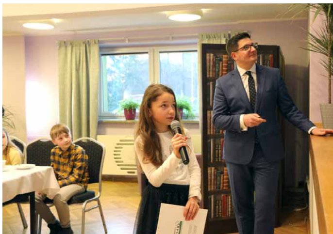
Stypendyści opowiadali o swoich osiągnięciach

Biegu Ulicznym, II miejsce w kategorii Open M w VII Myszowski Biegu Ulicznym, I miejsce w kategorii Open M w II Charytatywnym Biegu Karnawałowym w Konopiskach, I miejsce w V Biegu Mikołajkowym w Jaworznie, II miejsce w Biegu Przełajowym „Barbórka 2019” w Czeladzi, I miejsce w IX Biegu Ulicznym im. ks. Konstantego Damrota w Pilchowicach, II miejsce w I Piastowskim Biegu po Oddech w Wołowicach, I miejsce w kategorii M20 w XI Biegu o Puchar Burmistrza Miasta Pszów, II miejsce w VII Żorskim Biegu Ogniwym, I miejsce w IV Zalewie Biegaczy w Poraju, III miejsce w Jesiennych Biegach Przełajowych w Chorzowie, I miejsce Nocna Wataha (zima) w Olsztynie, I miejsce Nocna Wataha (jesień) w Olsztynie, I miejsce Nocna Wataha (lato) w Olsztynie.