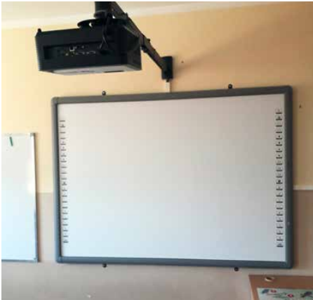
W szkole w Dąbiu zamontowano tablicę interaktywną

W ZWIĄZKU Z TRWAJĄCĄ PANDEMIĄ KORONAWIRUSA OD POŁOWY MARCA WSZYSTKIE SZKOŁY SĄ ZAMKNIĘTE, A NAUKA ODBYWA SIĘ ZDALNIE. CZAS TEN W PLACÓWKACH OŚWIATOWYCH ZNAJDUJĄCYCH SIĘ W GMINIE PSARY JEST WYKORZYSTYWANY NA BIEŻĄCE REMONTY ORAZ PRACE PORZĄDKOWE. WE WSZYSTKICH PLACÓWKACH PRZEPROWADZONA ZOSTAŁA TAKŻE REKRUTACJA DO KLAS PIERWSZYCH ORAZ PRZEDSZKOLI.