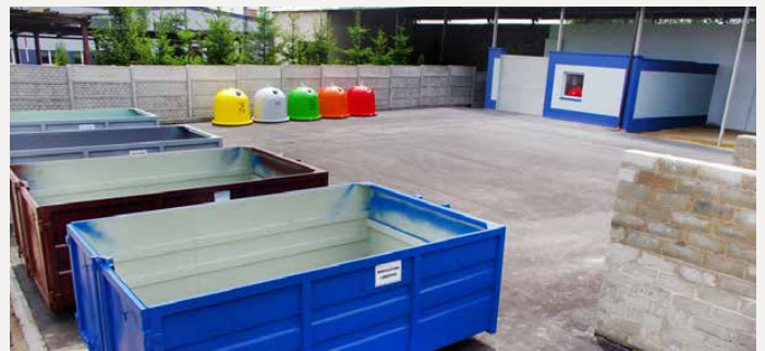
PSZOK w Dąbiu

Wszystkich mieszkańców dostarczających odpady do Punktu Selektywnego Zbierania Odpadów prosimy o stosowanie środków ochrony osobistej, przede wszystkim osłony na usta oraz nos i zachowanie odległości minimum 2 metry między osobami znajdującymi się na PSZOK. Red.