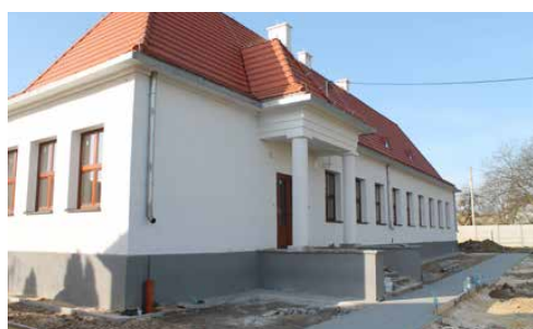
POSTĘPY PRAC W GOLĄSZY GÓRNEJ s. 5