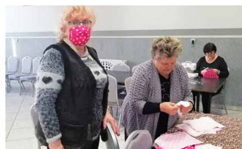
TRWA AKCJA SZYCIA I DYSTRYBUCJI MASECZEK OCHRONNYCH s. 11