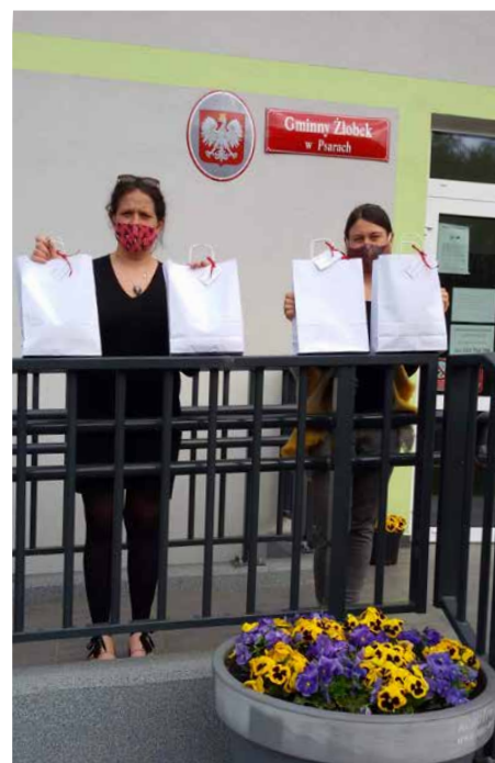
Gminny żłobek przekazał prawie 500 maseczek bawełnianych

na bazie alkoholu. Istotne jest, aby starać się nie dotykać maski podczas jej używania. Nie należy zakładać ponownie maseczki jednorazowego użycia, lecz od razu wyrzucić do zamkniętego pojemnika na śmieci. Maseczki bawełniane po ściągnięciu należy spryskać płynem dezynfekującym na bazie alkoholu o stężeniu min. 70 proc., wyprać w wysokiej temperaturze min. 60 stopni i po wysuszeniu wyprasować. Red.