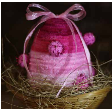
Uczniowie wykonali prace o tematyce świątecznej

W ZWIĄZKU Z ZAISTNIAŁĄ SYTUACJĄ SPOWODOWANĄ EPIDEMIĄ KORONAWIRUSA, ŚWIETLICA SZKOLNA W SARNOWIE DOŁĄCZA DO ZDALNEGO NAUCZANIA.