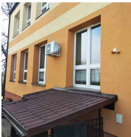
System klimatyzacji w przedszkolu w Strzyżowicach

ZAKOŃCZONO ZADANIE INWESTYCYJNE POLEGAJĄCE NA DOSTAWIE URZĄDZEŃ, MONTAŻU I URUCHOMIENIU INSTALACJI KLIMATYZACJI. PROJEKT PODZIELONY NA TRZY CZĘŚCI ZREALIZOWAŁA FIRMA ROZET Z KATOWIC.