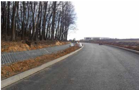
Nowa nawierzchnia drogi prowadzącej w kierunku Strzyżowic

Pogoda cały czas sprzyja inwestycjom w naszej gminie. Pomimo ograniczeń związanych z powstrzymaniem rozprzestrzeniania się koronawirusa firma Strabag intensywnie pracuje przy przebudowie DW 913. Czas mniejszego ruchu na drogach sprawia, że wprowadzona 9 marca tymczasowa organizacja ruchu zamy-