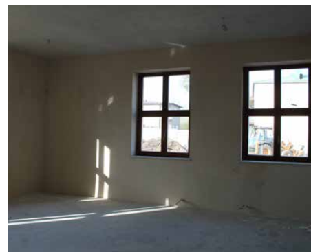
W pomieszczeniach wykonano przeciwwilgociowe posadzki

Gmina pozyskała dofinansowanie na to zadanie z wielu źródeł. Jednym z nich są dotacje unijne, na które składają się aż trzy projekty: