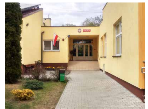
W Gródkowie przeprowadzono prace porządkowe wokół szkoły

na komunikatorach gdzie przekazują sobie informacje. Największym zainteresowaniem cieszy się możliwość kontaktu z nauczycielem i kolegami za pomocą programu Zoom. Wszystkie klasy łączą się ze swoimi wychowawcami oraz nauczycielami i prowadzone są zajęcia. W taki sposób również nauczyciele spotykają się w zespołach i omawiając z dyrektorem bieżące problemy organizują pracę zdalną. Podczas zdalnego nauczania często wykorzystywane są różne portale dotyczące oświaty i nauki. Epodreczniki służą jako uzupełnienie wiedzy i materiał do powtórek. Nie jest to taki system edukacji do jakiego byliśmy przyzwyczajeni, ale szybko musieliśmy się przestawić i pracować według nowych zasad. W ten sposób pracujemy także z uczniami o specjalnych potrzebach edukacyjnych, aby wspierać ich rozwój. Ogromnym zainteresowaniem cieszą się spotkania i konsultacje z pedagogiem i psychologiem. Na stronie naszej szkoły, a także w informacjach przesyłanych do rodziców i uczniów przedstawiona jest oferta ebiblioteki i eświetlicy. W myśl zasady potrzeba matką wynalazków ciągle poszukujemy nowych, atrakcyjnych rozwiązań. Także nasze przedszkolaki pracują zdalnie, a wychowawcy przesyłają emailowo wiadomości do rodziców z materiałami do pracy i zabawy. Czas zawieszenia stacjonarnych zajęć to czas wytężonej pracy na terenie placówki. Red.