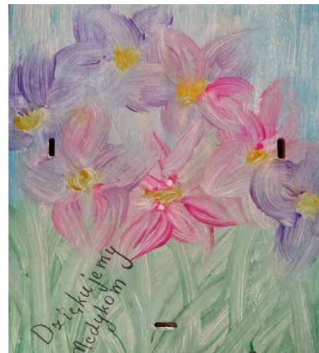
Jedna z prac dotycząca ogólnopolskiej akcji kartka dla medyka

Jej wychowawcy służą wsparciem i pomocą. Przez system Librus przesyłają uczniom różne propozycje spędzania wolnego czasu, między innymi zabaw rodzinnych, prac plastycznych, łąmigłówek, kolorowanek oraz gier i zabaw ruchowych. Każdy znajdzie coś odpowiedniego dla siebie! ZSP Sarnów