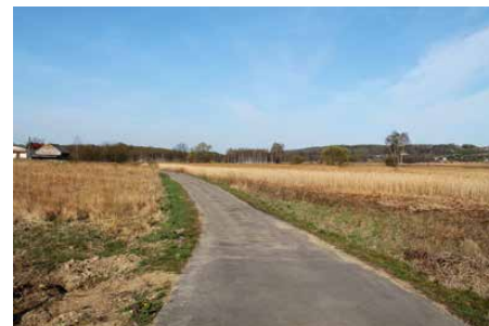
Ul. Zielona w Malinowicach

Planowane do zastosowania lampy uliczne wykorzystują energię elektryczną uzyskiwaną z modułów solarnych. Jest ona magazynowana w wydajnej baterii, a następnie wykorzystywana do oświetlenia terenu po zmroku. Zastosowanie specjalistycznych modułów solarnych nie wymaga budowy sieci kablowej. Red.