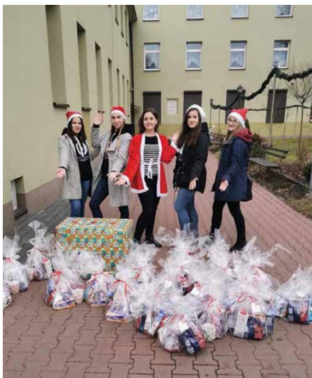
Uczestniczki projektu „Equal Kids”

W RAMACH OGÓLNOPOLSKIEJ OLIMPIADY PRAKTYCZNEJ „ZWOLNIENI Z TEORII” MIESZKANKI NASZEJ GMINY, UCZENNICE I LICEUM OGÓLNOKSZTAŁCĄCEGO IM. JANA SMOLENIA W BYTOMIU, KIERUJĄC SIĘ CHĘCIĄ NIESIENIA POMOCY, POSTANOWIŁY NAWIĄZAĆ WSPÓŁPRACĘ Z JEDNYM Z DOMÓW DZIECKA. DZIĘKI STWORZONEJ PRZEZ NIE GRUPIE „EGUAL KIDS” (TZN. „RÓWNE DZIECI”), PODOPIECZNI Z DOMU DZIECKA W SARNOWIE PRZEŻYLI NIEZAPOMNIANE CHWILE.