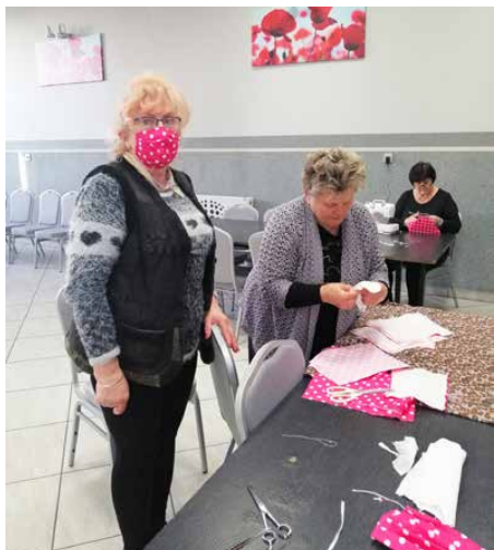
Panie z klubu seniora Brzękowie-Goląsza podczas szycia maseczek

W trosce o bezpieczeństwo gmina Psary zakupiła materiały niezbędne do wykonania maseczek ochronnych oraz nabyła 3610 sztuk maseczek jednorazowych i wielokrotnego użytku.