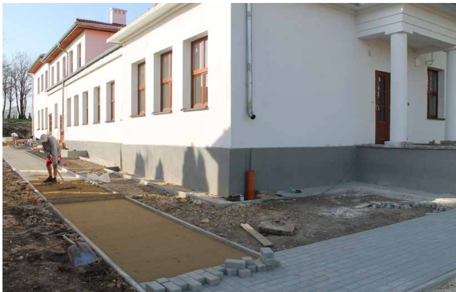
Wokół budynku powstają chodniki z kostki brukowej

DOBIEGA KOŃCA KOMPLEKSOWA MODERNIZACJA ENERGETYCZNA I PRZEBUDOWA BUDYNKU BYŁEJ SZKOŁY W GOLĄSZY GÓRNEJ. W PLACÓWCE ZOSTANIE UTWORZONY KLUB AKTYWNEGO MIESZKAŃCA I MIESZKANIA CHRONIONE. ŁĄCZNIE WARTOŚĆ PRAC NA ZEWNĘTRZ I WEWNĄTRZ BUDYNKU WYNOŚI 2 649 837,15 ZŁ, Z CZEGO 1 801 402,28 ZŁ STANOWIĄ POZYSKANE DOTACJE. WYBRANO TAKŻE WYKONAWCĘ ZAGOSPODAROWANIA OTOCZENIA BUDYNKU.