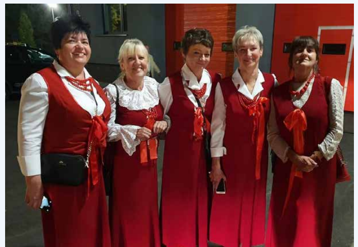
Koło Gospodyń Wiejskich z Preczowa otrzymało dofinansowanie na zakup koralików i butów

Wnioskodawcom rozdane zostały granty w wysokości od 1 000 zł do 5 000 zł, które mogą rozdysponować realizując swój projekt. W związku z otrzymaniem dofinansowania w kwocie 4 290,00 zł KGW Preczów przeznacza dotację na zakup 22 par butów i koralików do stroju ludowego. Gratulujemy serdecznie!