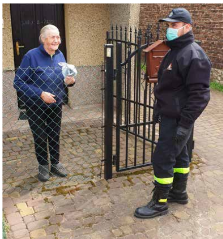
Dostarczeniem maseczek zajmują się drухowie z gminnych jednostek OSP

OD 16 KWIETNIA W CAŁEJ POLSCE, W ZWIĄZKU ZE STANEM EPIDEMII, OBOWIĄZKOWE JEST ZASŁANIANIE NOSA I UST W PRZESTRZENI PUBLICZNEJ. OZNACZA TO KONIECZNOŚĆ NOSZENIA MASECZEK, SZALIKÓW CZY CHUSTEK, JEŚLI TYLKO ZDECYDUJEMY SIĘ WYJŚĆ Z DOMU.