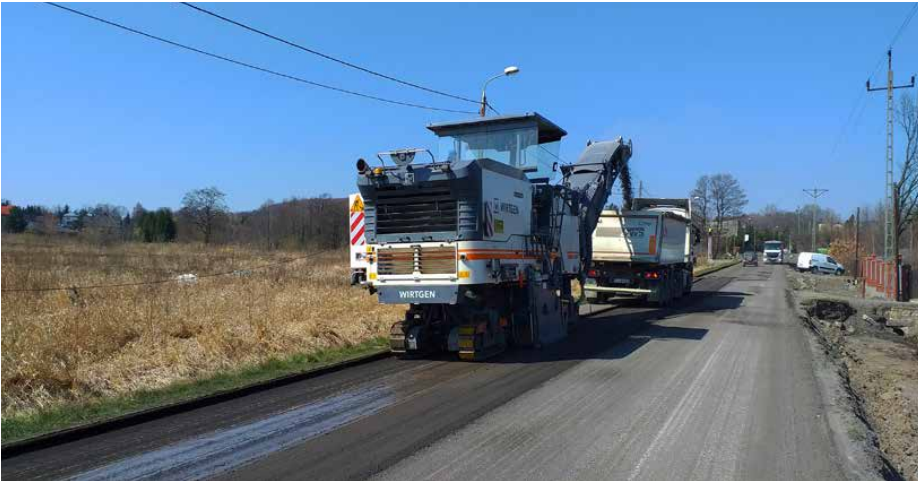
Frezowanie starej powierzchni drogi asfaltowej

TRWA PRZEBUDOWA DW 913. STABILIZACJA PODŁOŻA, WYKONANIE PODBUDÓW Z KRUSZYWA CZY MONTAŻ KRAWĘŻNIKÓW BETONOWYCH, TO CZĘŚĆ Z WYKONANYCH JUŻ PRAC NA POSZCZEGÓLNYCH ODCINKACH.