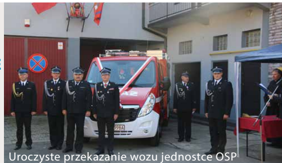
Uroczyste przekazanie wozu jednostce OSP

6 PAŹDZIERNIKA NA PLACU PRZED BUDYNKIEM OSP GOLAŚZA-BRZĘKOWICE NASTĄPIŁO UROCZYSTE PRZEKAZANIE I POŚWIĘCENIE NOWEGO LEKKIEGO WOZU RATOWNICZO-GAŚNICZEGO JEDNOSTCE OCHOTNICZEJ STRAŻY POŻARNEJ.