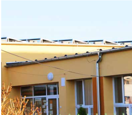
Panele fotowoltaiczne na dachu placówki

ZAKOŃCZONO JUŻ WSZYSTKIE PRACE ZWIĄZANE Z TERMOMODERNIZACJĄ SZKOŁY PODSTAWOWEJ W STRYŻOWICACH, A W PAŹDZIERNIKU ROZPOCZĘTO KOLEJNĄ INWESTYCJĘ W TEJ PLACÓWCE, JAKĄ JEST MONTAŻ PANELI FOTOWOLTAICZNYCH. DZIĘKI TYM PRZEDSIĘWZIĘCIOM, KTÓRE SĄ WSPARTE UNIJNYMI DOTACJAMI W SZKOLE BĘDZIE CIEPLEJ, A OPŁATY ZA OGRZEWANIE BĘDĄ NIŻSZE.