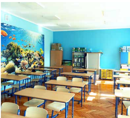
Pracownia „Ocean wiedzy” w Sarnowie

UCZNIOWIE ZE SZKÓŁ W SARNOWIE I DĄBIU W CIEKAWY SPOSÓB ZDOBYWAJĄ WIEDZĘ Z PRZEDMIOTÓW ZWIĄZANYCH ZE ŚRODOWISKIEM NATURALNYM. WSZYSTKO DZIĘKI NOWOCZESNYM PRACOWNIOM BIOLOGICZNYM, TZW. ZIELONYM PRACOWNIOM, KTÓRE SĄ WSPÓŁFINANSOWANE PRZEZ WOJEWÓDZKI FUNDUSZ OCHRONY ŚRODOWISKA I GOSPODARKI WODNEJ W KATOWICACH.