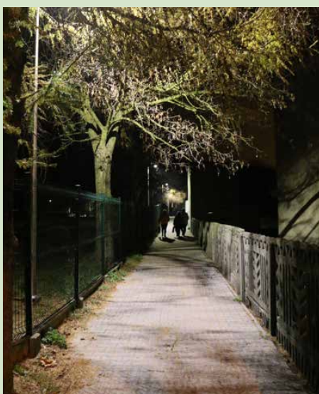
Przy chodnikach zamontowano 10 lamp led