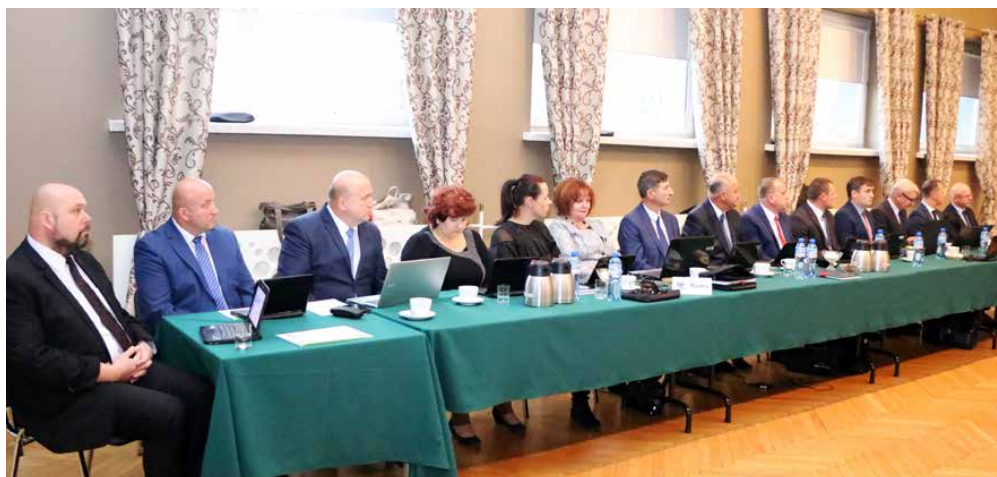
Radni kadencji 2018-2023 podczas I sesji