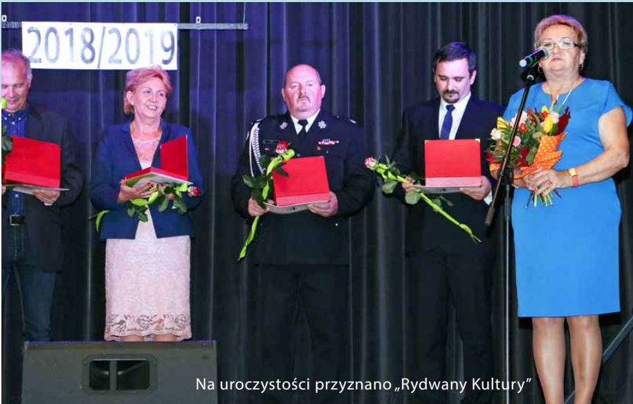
Na uroczystości przyznano „Rydwany Kultury”

14 PAŹDZIERNIKA W GMINNYM OŚRODKU KULTURY W GRÓDKOWIE ODBYŁA SIĘ COROCZNA INAUGURACJA ROKU KULTURALNEGO, NA KTÓREJ ZOSTAŁY PRYZNANE „RYDWANY KULTURY” ORAZ ODBYŁ SIĘ KONCERT KABARETOWY JACKA ZIOBRY.