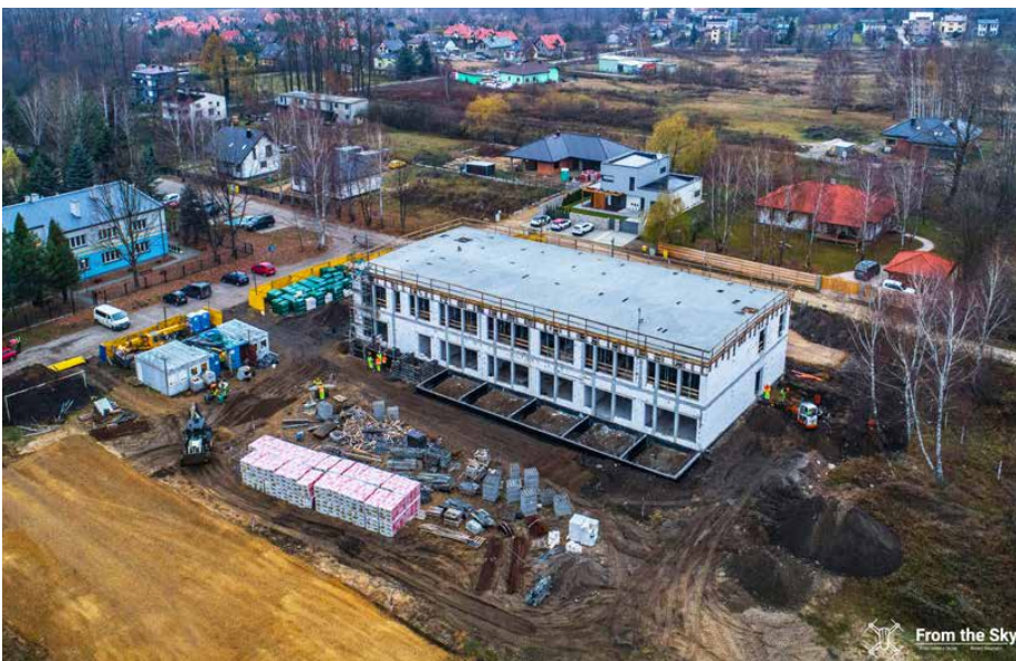
Prace przy budowie placówki wchodzą już w kolejny etap

Urząd Gminy w Psarach złożył wnioski o dofinansowanie budowy żłobka w formie dotacji w wysokości 1 127 200 zł i w formie pożyczki w wysokości 1 127 200 zł do Narodowego Funduszu Ochrony Środowiska i Gospodarki Wodnej w Warszawie oraz pozyskał dotację unijną w kwocie 433 784,06 zł w ramach Zintegrowanych Inwestycji Terytorialnych Regionalnego Programu Operacyjnego Województwa Śląskiego na lata 2014-2020. Red.