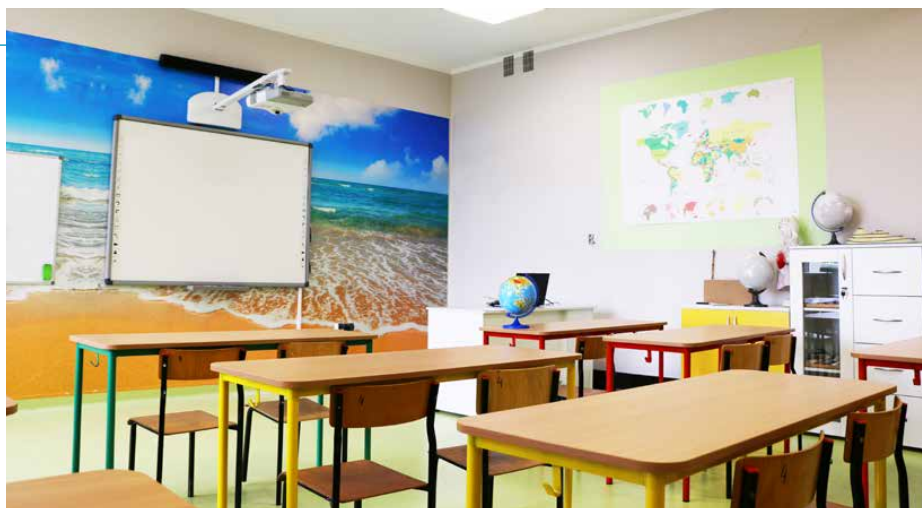
Pracownia „Dary natury” w Dąbiu

Zielone pracownie powstają z myślą o uatrakcyjnieniu warunków nauczania oraz podnoszeniu świadomości ekologicznej uczniów. W gminie Psary pierwsza ekopracownia została otwarta na początku 2017 r. w szkole w Gródkowie, a jesienią tego roku