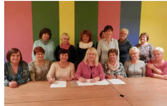
Lokalna Grupa Kobiet „18+VAT” organizuje nowy projekt

nadzieję, że w plenerze, wśród drzew pięknie zaistnieją świetlne girlandy, snujące się kołеды i stragany pełne smacznych, ciepłych potraw. Już dzisiaj zapraszamy wszystkich mieszkańców sołectw Dąbie, Gołąsza i Brzękowiec do udziału 14 grudnia 2018 roku o godzinie 12.30. LOKALNA GRUPA KOBIET „18+VAT”