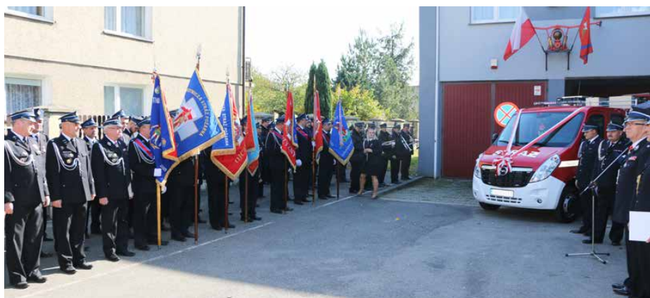
Wśród zaproszonych gości byli druhowie z jednostek OSP z gminy Psary

Wóz ratowniczo-gaśniczy o wdzięcznym imieniu Tadzio jest doskonale wyposażony i przystosowany do samodzielnych akcji strażackich. Posiada zarówno motopompy, jak i profesjonalny sprzęt hydrauliczny. Jego koszt wyniósł 247 045,50 zł. Red.