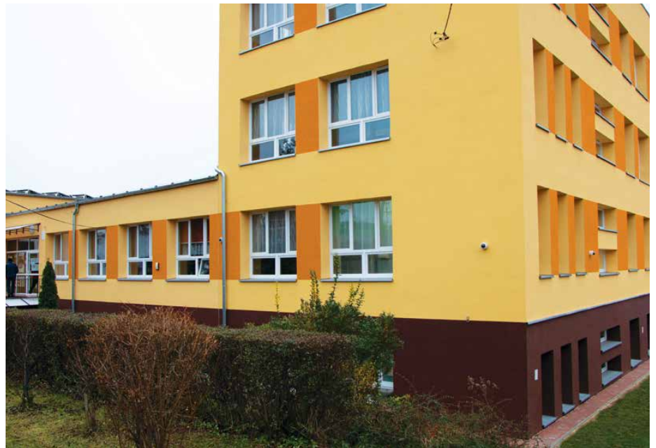
Szkoła w Strzyżowicach po termomodernizacji

W październiku rozpoczęto kolejną inwestycję jaką jest montaż odnawialnych źródeł energii na dachu szkoły. W ramach tego zadania zostanie zamontowanych 55 paneli fotowoltaicznych do produkcji energii elektrycznej. Również ta, warta 58 993 zł inwestycja, została objęta dofinansowaniem sięgającym 85% z Regionalnego Programu Operacyjnego Województwa Śląskiego na lata 2014-2020. Wykonawcą jest EKON PV Sp. z o.o. z Dąbrowy Górniczej. Red.