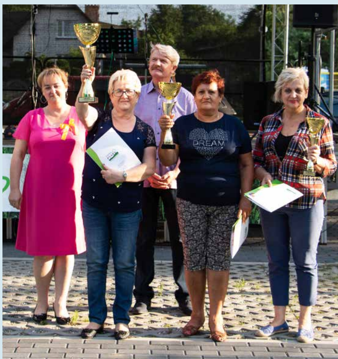
Koło Polskiego Związku Emerytów, Rencistów i Inwalidów z Malinowic zajęło I miejsce w I Gminnej Senioriadzie

Przede wszystkim będziemy się dalej spotykać. Chcemy rozwijać nasz obiekt. Ostatnio zagospodarowano nasz teren przy byłej szkole w Malinowicach. Powstały dwie olbrzymie, zadane wiaty. Cały plac wyłożony jest kostką brukową. Tam organizujemy nasze letnie spotkania: ogniska, występy itp. Planujemy wycieczki, ogniska, spotkania. Ciągłe chcemy działać z policją, biblioteką – wszystko po to by nasi seniorzy ciągle się rozwijali.